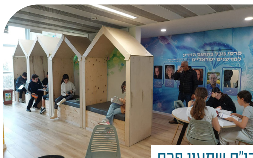
בי"ס שמעון פרס