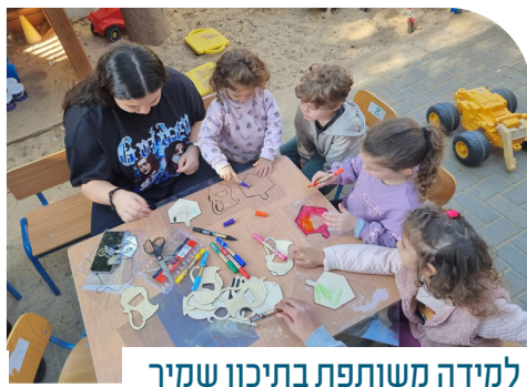
למידה משותפת בתיכון שמיר

אגף החינוך בעיריית כפר סבא פועל, בשיתוף גני הילדים, בתי הספר וההורים - לקידום יצירתיות, יזמות וחדשנות בכל מוסדות החינוך העירוניים ברחבי העיר. בין היתר ביצירת תכנים פדגוגיים מובילים, הטמעת תוכניות חינוכיות וחברתיות חדשות, יצירת פעילויות פורצות דרך וחשיבה מחוץ לקופסה. כל אלה הפכו את החינוך בכפר סבא למודל ודוגמה לערים אחרות ומיצובו בצמרת החינוך הארצי.