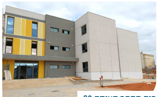
בית הספר הצומח 80