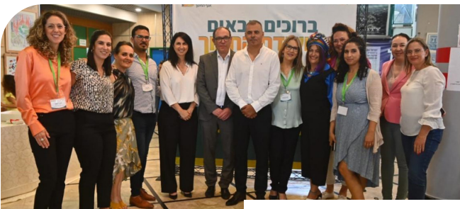
ועידת החינוך העירונית

כחלק משיתוף ההורים ופעילות משותפת עם הנהגת ההורים העירונית, התקיימה בעיר ועידת החינוך העירונית, בהשתתפות עשרות רבות של הורים, שלקחו חלק במעגלי שיח וחשיבה משותפת.