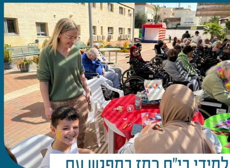
תלמידי בי"ס רמז במפגש עם דיירי בית דור מוגן בגלגוליה