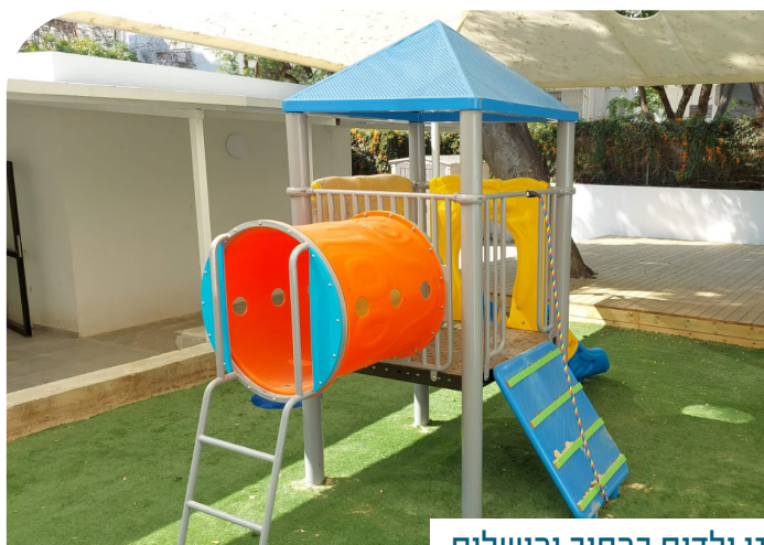
גן ילדים ברחוב ירושלים

מרחבי למידה מסוג זה הוקמו בבתי הספר ברחבי העיר כולה, כאשר בגני הילדים חודשו והונגשו חצרות ומבני הגנים.