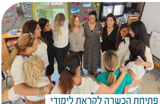
פתיחת הכשרה לקראת לימודי תואר ראשון לסייעות