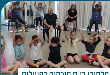
תלמידי בי"ס סורקיס בפעילות חווייתית עם אזרחים ותיקים