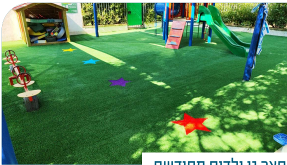
חצר גן ילדים מחודשת