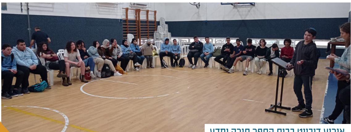
אירוע דיבייט בבית הספר תורה ומדע