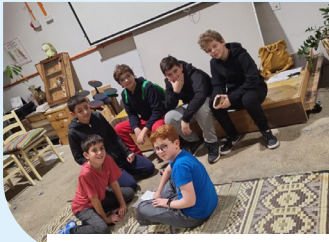
נבחרת בי"ס ש"ר עגנון