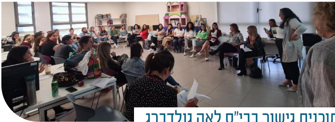
תוכנית גישור בבי"ס לאה גולדברג