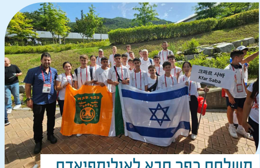
משלחת כפר סבא לאולימפיאדת הילדים בדרום קוריאה