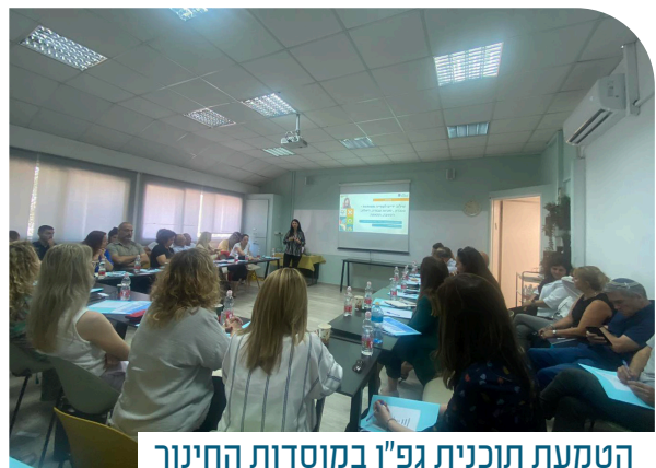
הטמעת תוכנית גפ"ן במוסדות החינוך