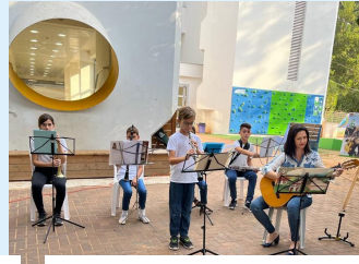
פעילות מוזיקלית בבי"ס אוסישקין