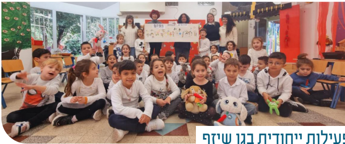
פעילות ייחודית בגן שיזף