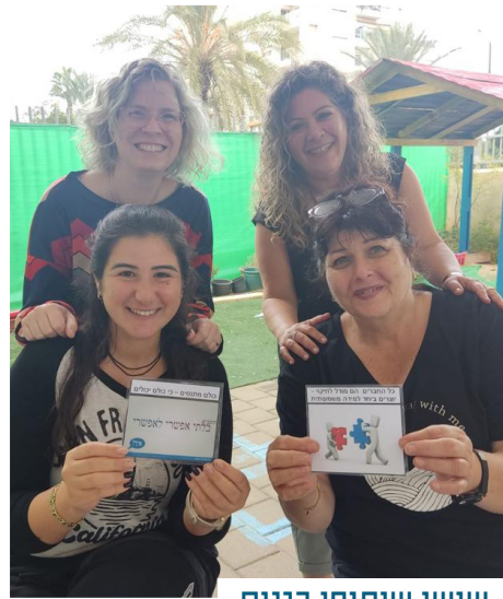
שישי שיתופי בגנים