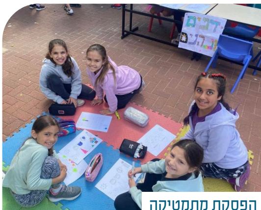
הפסקת מתמטיקה מעשירה בבי"ס סורקיס