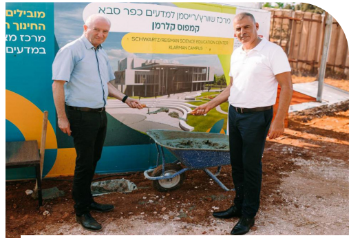
טקס הנחת אבן הפינה למרכז המדעים הראשון מסוגו.

מדובר ביזמה ייחודית מסוגה של עיריית כפר סבא, באמצעות החברה הכלכלית לפיתוח העיר, ובשיתוף עם מרכז שוורץ/רייסמן, מייסודו של מכון ויצמן.