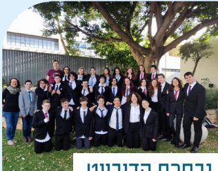
נבחרת הדיבייט חטיבת שרת