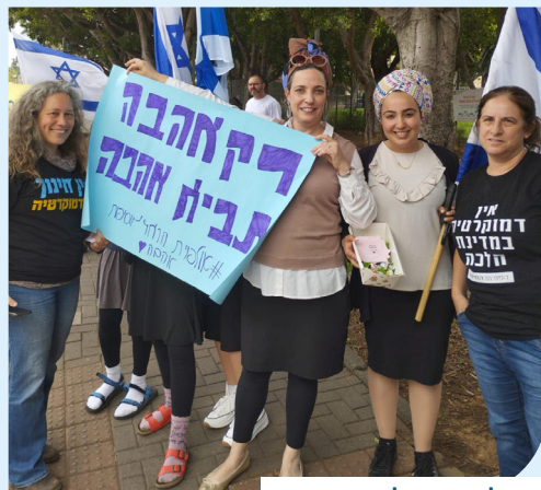
פעילות "מילה טובה" של אולפנת הראל