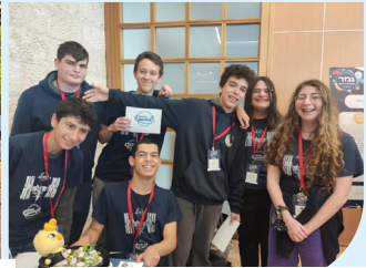
נבחרת ספייסלאב רמון