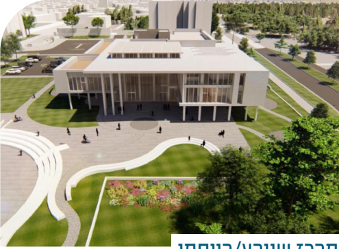
מרכז שוורץ/רייסמן. הדמיה: חן אדריכלים ואדריכל ירון קוטיק