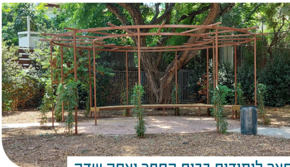
חצר לימודית בבית הספר יצחק שדה