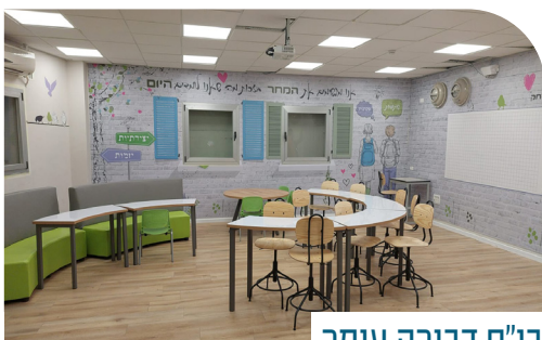
בי"ס דבורה עומר