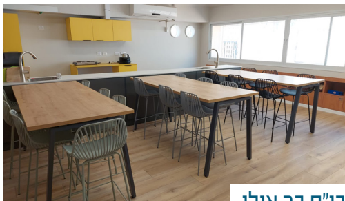
בי"ס בר אילן

במהלך השנה האחרונה המשיכה עיריית כפר סבא ביעד שהציבה לעצמה - לחדש את מוסדות החינוך בעיר ולהקים מרחבי למידה חדשניים, המותאמים לפדגוגיית העתיד ומאפשרים למידה רב תחומית, שיתופית, המותאמת לכל ילדה וילד.