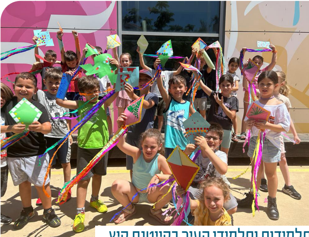
תלמידות ותלמידי העיר בקייטנת קיץ

העיר כפר סבא פיתחה מודל ייחודי - הקמפוס החינוכי, במסגרתו הוטמעה תוכנית "מרחבי חינוך, בחירה מבוקרת ופיתוח זהות ייחודית בית ספרית" בבתי הספר היסודיים - התוכנית אפשרה פתיחת אזורי הרישום לכיתות א' בכל העיר לבחירת ההורים, תוך פיתוח ייחודיות לכל בית ספר. זאת בנוסף לפיתוח ייחודיות וזהות בית ספרית בחטיבות הביניים - על מנת לאפשר לתלמידות ותלמידי