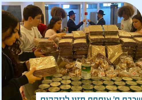
שכבת ח' אוספת מזון לנזקקים