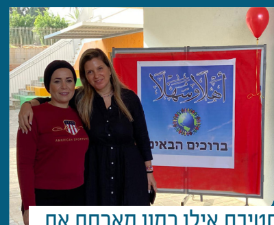
חטיבת אילן רמון מארחת את חטיבת אבו סנין מקלאנסווה