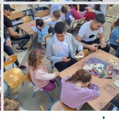
תלמידי תיכון שמיר מתנדבים בקהילה