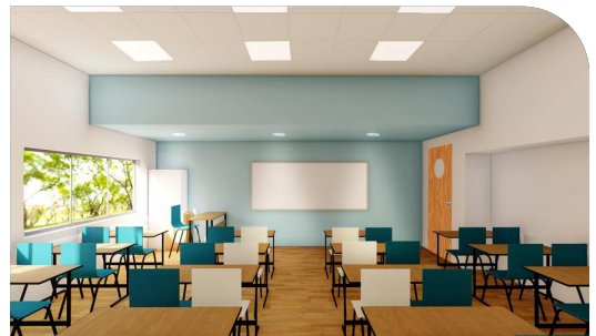
הכיתות החדשות בתיכון גלילי (הדמיה)