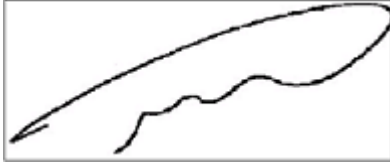
רמי אמיר, שופט