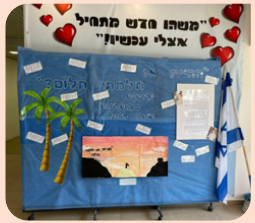
תוצרי עבודות התלמידים הוצגו בתערוכה בבית הספר