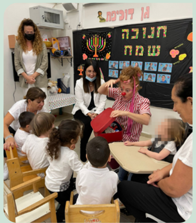
כפר-סבא מצדיעה לגננות החינוך המיוחד בעיר

בכפר - סבא פועלים 29 גני חינוך מיוחד, הנותנים מענה לקשת רחבה של צרכים ולקוויות, ומאפשרים למידה מכבדת ומקצועית של התלמידים/ות. גננות החינוך המיוחד בכל יום ובעיקר בתקופת הקורונה, מתייצבות במסירות, באהבה ובמקצועיות. סביב טיפוח ובניית מרחב חינוכי טיפולי מקדם עבור כל תלמיד ותלמידה. בתאריך 29/11 לפני יציאה לחופשת החנוכה, ההנהגה החינוכית והטיפולית בעיר, ביקרה בגני החינוך המיוחד, אשר פתחו את שעריהן ואפשרו למתארחים ללמוד על העשייה המרגשת, מלאת התעצמות, האופטימיות והצעידה קדימה. ביום זה הצדענו לעשייה החינוכית המכבדת להובלה ולבניית חינוך מקצועי ומעצים, ובעיקר לאמונה בדרך! יום זה נצבע בגנים כיום מיוחד, בו כל גן הציג את הזהות המיוחדת לו, את התפיסות, הערכים והדגשים המיוחדים לו. כולנו התרגשנו, והודנו לכלל צוותי החינוך ולצוותי החינוך המיוחד בפרט. ביום זה התמלאנו בגאווה של חינוך כפר סבא משובח ומקצועי. ולכן גננות חינוך מיוחד וצוותי חינוך בגנים - תודה על לב גדול, מקצועיות והובלה.