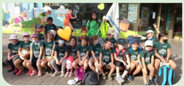
ביה"ס שי עגנון

6 בתי ספר - תיכון רבין, חטיבת אלון, בית הספר הדמוקרטי, בתי הספר היסודיים יצחק שדה ושי"עגנון, פועלים למען העלאת המודעות לשינוי האקלים. בתי ספר אלו השתתפו במצעד האקלים בתל אביב. המצעד הינו אירוע בהיקף עולמי. לקראת המצעד התקיימו שיעורי הכנה בנושא פסולת וזיהום.