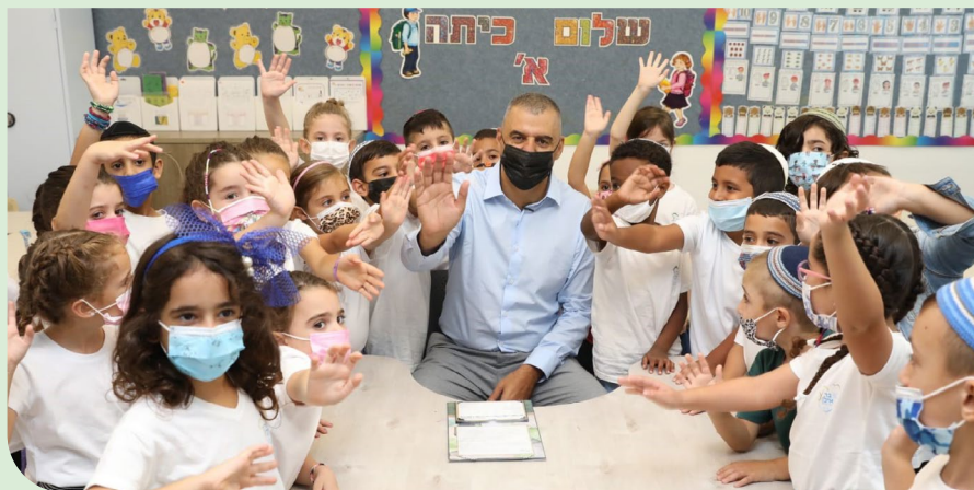
פתיחת שנת הלימודים תשפ"ב בבית הספר בר אילן, צילום: רענן כהן

שנת הלימודים תשפ"ב נפתחה בכפר סבא ב-1 לספטמבר עם שובם של 24,378 תלמידי בתי הספר והגנים למוסדות החינוך בעיר.