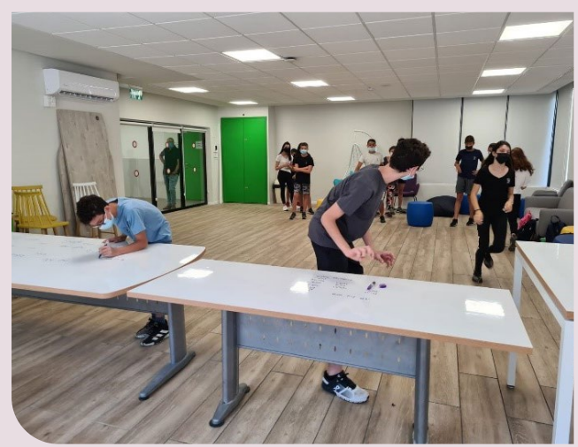
תלמידות ותלמידי שז"ר בפעילות