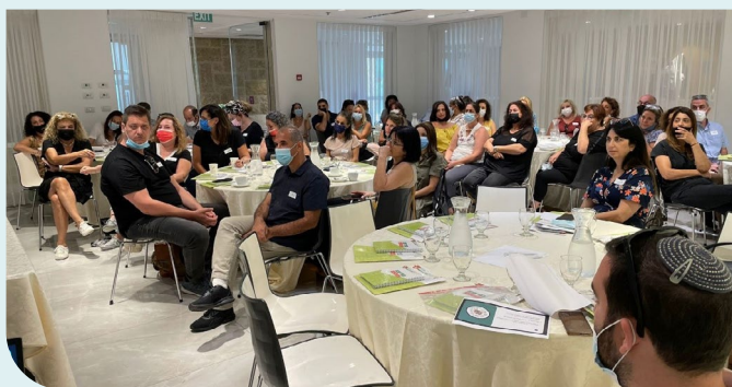
משתתפי הכנס - ההנהגה החינוכית העירונית