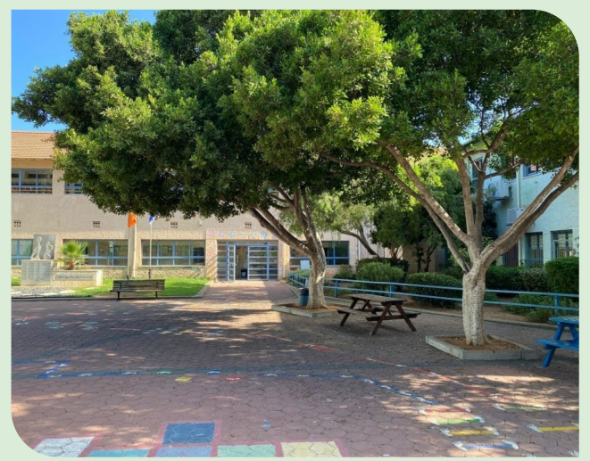
בית הספר ברנר (צילום: טל ברמן סגל)

במסגרת ההסכמות, אישר משרד החינוך תוספת של מכסת שעות פדגוגיות שתאפשר את חלוקת הילדים בשכבה ד' ל-4 כיתות, במקום הצמצום המתוכנן של השכבה ל-3, כפי שיעד תחילה משרד החינוך. בעקבות החלטת משרד החינוך לצמצום כיתות בשכבת ד' של בית הספר, נכנס אגף החינוך בעיריית כפר סבא בהובלת ראש העיר לדיונים מול משרד החינוך במטרה למצוא פתרון מוסכם למען תלמידי ברנר.