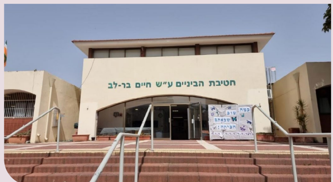
חטיבת בר לב

לכבוד סיום שנת הלימודים תשפ"א, הוכרזו 23 בתי ספר יסודיים ועל יסודיים בכפר סבא כבתי ספר מקדמי בריאות. כל אחד מבתי הספר מקיים תוכניות שמטרתן לעודד, לשפר ולשמר את בריאותם הפיזית והנפשית של התלמידים. קידום הבריאות הבית ספרי מתאפשר בזכות שיתופי פעולה נרחבים בין הצוות החינוכי של בתי הספר, לאגפים השונים בעירייה, ביניהם המחלקה לקידום הבריאות והחוסן העירוני, ועמותות וארגונים הפועלים בתחומי הבריאות. כחלק מהקריטריונים לזכייה בתואר, נמדדים חינוך נכון לתזונה, פעילות גופנית וחוסן נפשי.