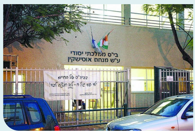
בתי הספר אוסישקין וכצנלסון