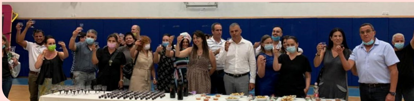
הרמת כוסית לכבוד השנה החדשה בסיום הישיבה

עיריית כפר סבא ערכה ב-1.9 ישיבה חגיגית לפתיחת שנת הלימודים תשפ"ב, בה הוצגה תוכנית העבודה האסטרטגית למערכת החינוך. הישיבה שודרה בלייב והוזמנו כלל חברי המועצה, נציגי אגף החינוך, ומנכ"לית עיריית רעננה לשעבר, מיכל הירש גרי - המלווה את העירייה יחד עם שר החינוך שלעבר, הרב שי פירון, בגיבוש תוכנית החינוך. בנוסף, הזומנו מנהלי בתי ספר, רכזות אשכולות הגנים, נציגי החברה לתרבות הפנאי וועד ההורים.