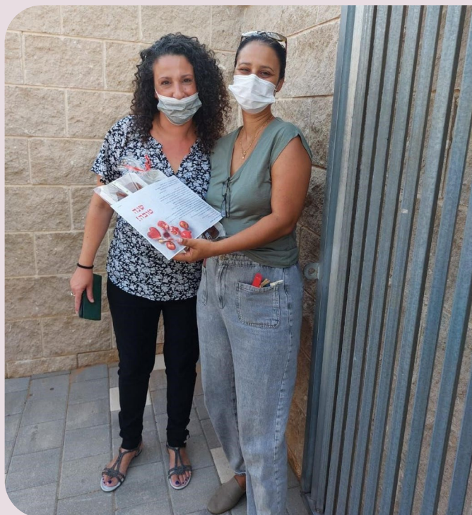
מנהלת בית הספר והורים פותחים את השנה יחד

התחדשנו בבית ספר חדש. בית חינוך צומח 80 הוא בית ספר חדש שעושה את צעדיו הראשונים בשכונת כפר סבא הירוקה. בית החינוך ממוקם במבנה גנים לשעבר ומונה 73 תלמידים ו-14 אנשי צוות.