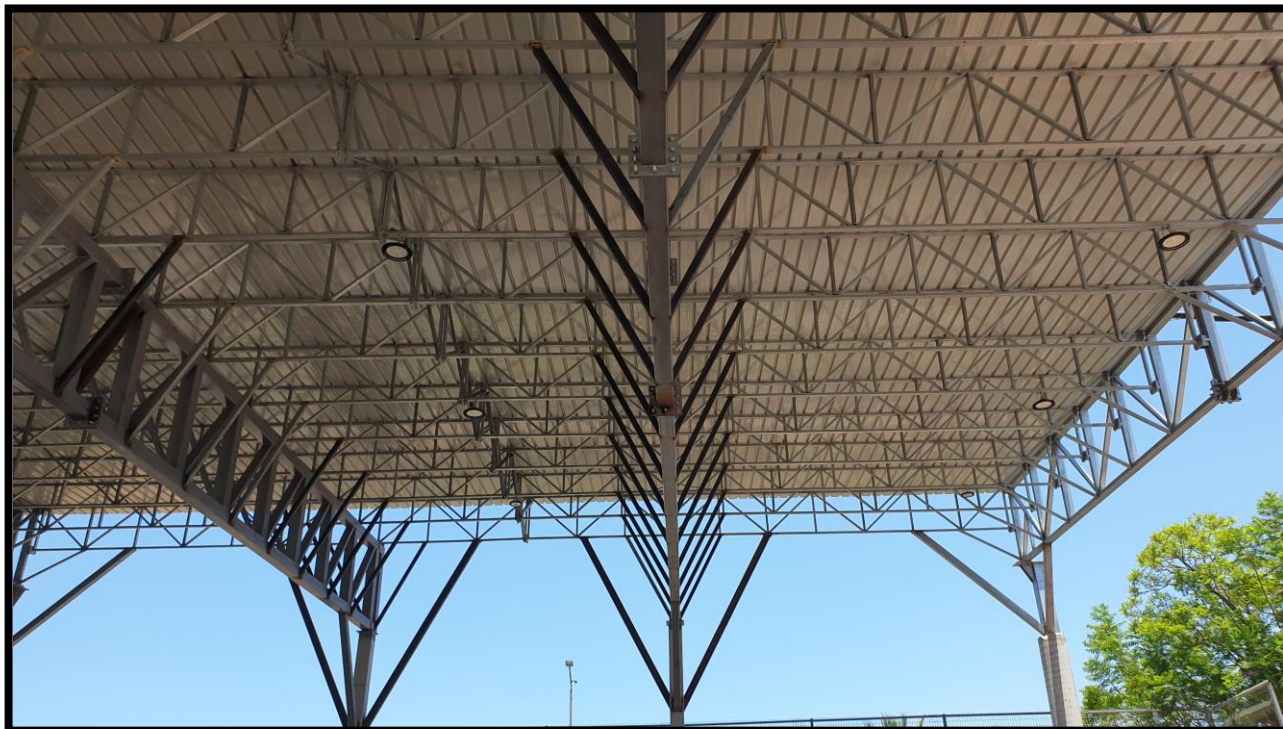
תוספת אגדים עבור הסככה המזרחית