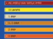
በዓዛ ክልል የሚገኙ ሰፈራዎች