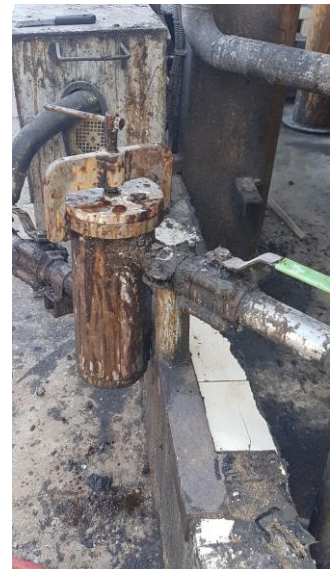
צולמה על ידי אירה אלימלך בתאריך 12/05/2020